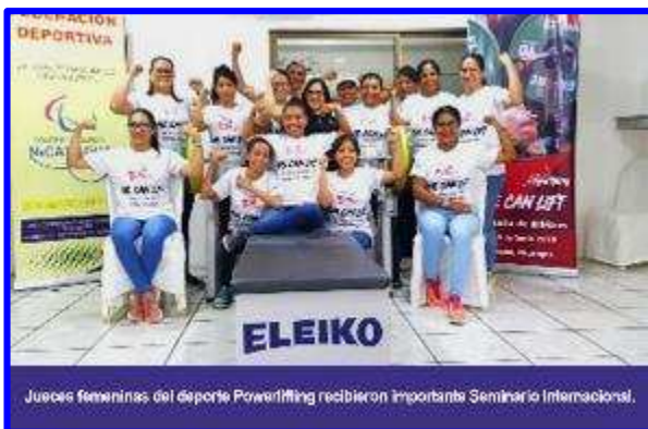
Jueces femeninas del deporte Powerlifting recibieron importante Seminario Internacional.

La Federación del Comité Olímpico Nicaragüense (FECOPAN), sigue con paso firme desarrollando sus plan de actividades del 2019, con el objetivo de mantener actualizados sus conocimientos en materia deportiva así como consolidando la calidad técnica en cada uno de sus atletas.