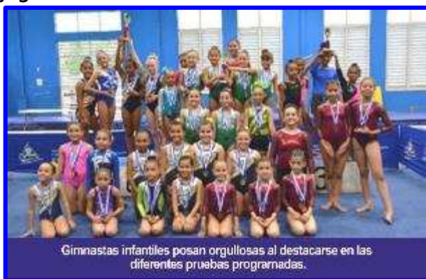
Gimnastas infantiles posan orgullosas al destacarse en las diferentes pruebas programadas.

Las competencias de Gimnasia (6-12 años) se efectuaron en sábado 15 de Junio en las instalaciones del gimnasio ubicado en el Polideportivo España resultando ganadoras de los diferentes