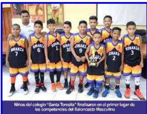
Niños del colegio "Santa Teresita" finalizaron en el primer lugar de las competencias del Baloncesto Masculino.

Con el deporte del Baloncesto en la rama femenina y masculina , concluyeron las competencias de dichos Juegos logrando el campeonato por las niñas el colegio "Moravo" de Bluefields y por los niños los atletas del colegio "Santa Teresita" de Las Minas (Bonanza). En segundo lugar se colocaron los equipos: Gabriela Mistral de Jinotega (masculino) y Francisca García de Matagalpa (femenino). En el tercer lugar finalizaron: colegio "Uriel Reyes" de Managua en la rama masculina y la escuela "Más Vida" de Estelí en femenino.