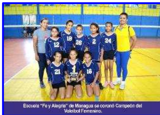
Escuela "Fe y Alegría" de Managua se coronó Campeón del Voleibol Femenino.