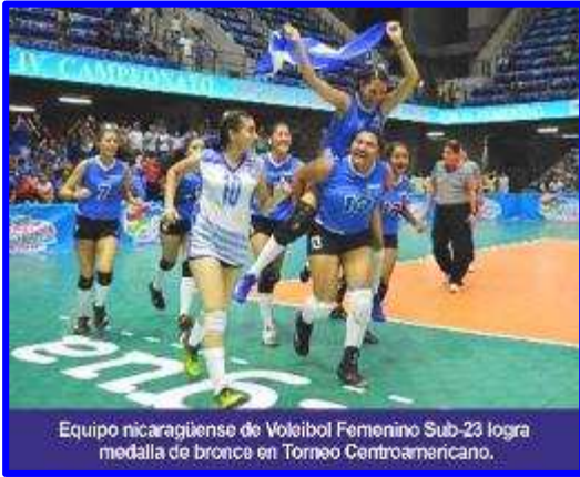
Equipo nicaragüense de Voleibol Femenino Sub-23 logra medalla de bronce en Torneo Centroamericano.

Costa Rica logró su cuarta corona seguida al terminar la contienda con balance perfecto de seis victorias sin derrotas y 28 puntos, seguido por Belice, Nicaragua, Honduras, El Salvador, Guatemala y Panamá.