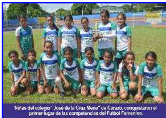
Niñas del colegio "José de la Cruz Mena" de Carazo, conquistaron el primer lugar de las competencias del Fútbol Femenino.

En las competencias de dichos Juegos se realizaron también las del Fútbol femenino que tuvo la participación de 18 equipos que en divididas en 6 grupos se entregaron de lleno para buscar posesionarse en los tres primeros lugares. El primer lugar de la contienda se lo adjudicó el equipo del centro de estudio "José de la Cruz Mena"