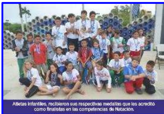
Atletas infantiles, recibieron sus respectivas medallas que les acreditó como finalistas en las competencias de Natación.

En los deportes dieron la batalla los atletas del Voleibol masculino y femenino , lograron quedarse con el campeonato los equipos "Fe y Alegría de Managua en la rama femenina y en la rama masculina el colegio "Rubén Darío" de Río San Juan. En los segundo logares finalizaron: en masculino el colegio "Cristo Rey" de Chontales y en femenino la escuela "Nuestra Señora del Rosario" de Estelí. Los terceros lugares fueron para los