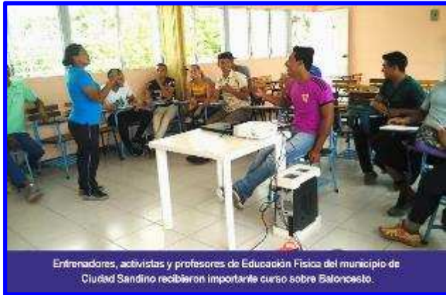
Entrenadores, activistas y profesores de Educación Física del municipio de Ciudad Sandino recibieron importante curso sobre Baloncesto.

De tal manera que del 10 al 14 de Junio en el Municipio del Ciudad Sandino,