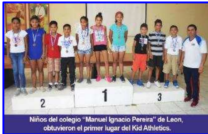
Niños del colegio "Manuel Ignacio Pereira" de Leon, obtuvieron el primer lugar del Kid Athletics.

De acuerdo al calendario de competencias el otro deporte que disputó los primeros puestos fue el Kid Athletics (comprendió las pruebas: lanzamiento de jabalina, velocidad y vallas, resistencia, lanzamiento hacia tras de pelota, carrera 10x10 metros, salto lateral de un obstáculo bajo) logrando imponerse el equipo representado por los atletas de la escuela de