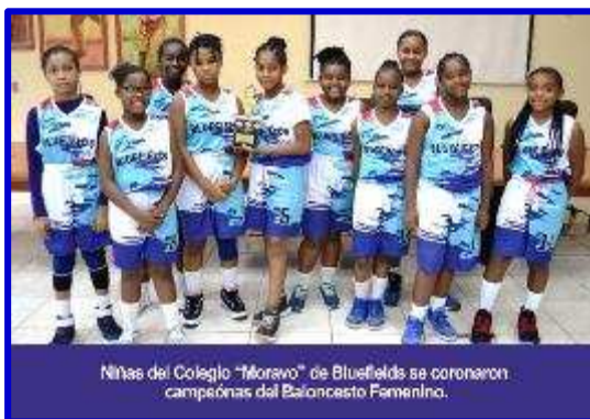
Niñas del Colegio "Moravo" de Bluefields se coronaron campeonas del Baloncesto Femenino.