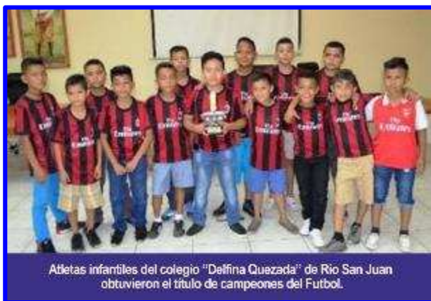
Atletas infantiles del colegio "Delfina Quezada" de Rio San Juan obtuvieron el título de campeones del Fútbol.