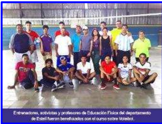
Entrenadores, activistas y profesores de Educación Física del departamento de Estelí fueron beneficiados con el curso sobre Voleibol.